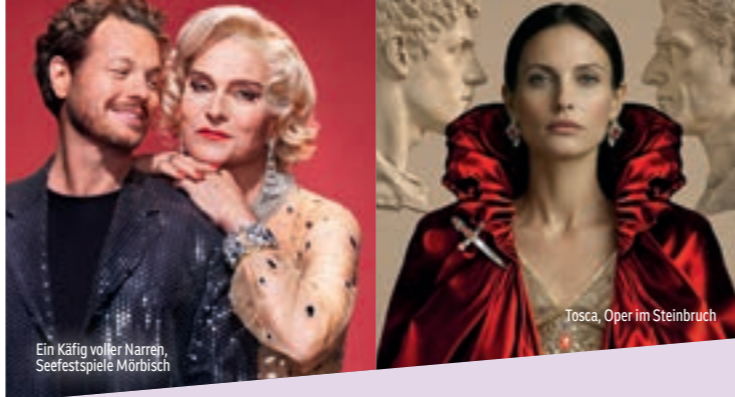
Ein Käfig voller Narren, Seefestspiele Mörbisch

ERÖFFNUNG BREGENZER FESTSPIELE Produktion ORF Vorarlberg Mi, 22. 7., live, 9.55 Uhr, ORF 2 und 10.30 Uhr, 3sat